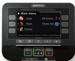
Выбор множества программ и режимов тренировки