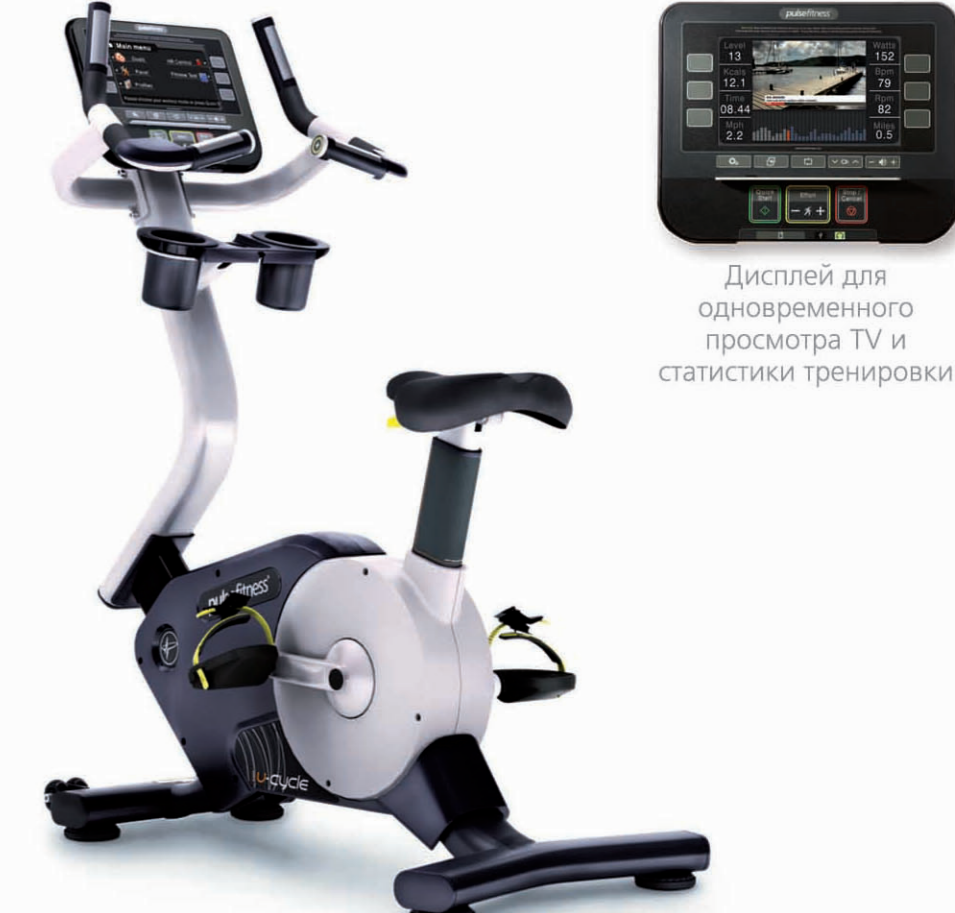
Дисплей для одновременного просмотра TV и статистики тренировки

Новейшая модификация популярного вертикального велотренажера: велотренажер Fusion позволяет осуществлять захватывающую тренировку. Тренажер имеет стильные мультипозиционные рукоятки с поддержкой локтей, способствующей наиболее комфортной и максимально эффективной тренировке; контурное сиденье с 10-ти уровневой регулировкой, которую можно осуществлять одной рукой для максимального комфорта.