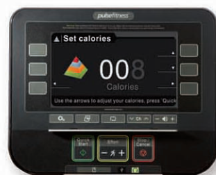
Легко программируемый, 10 дюймовый цветной TFT дисплей