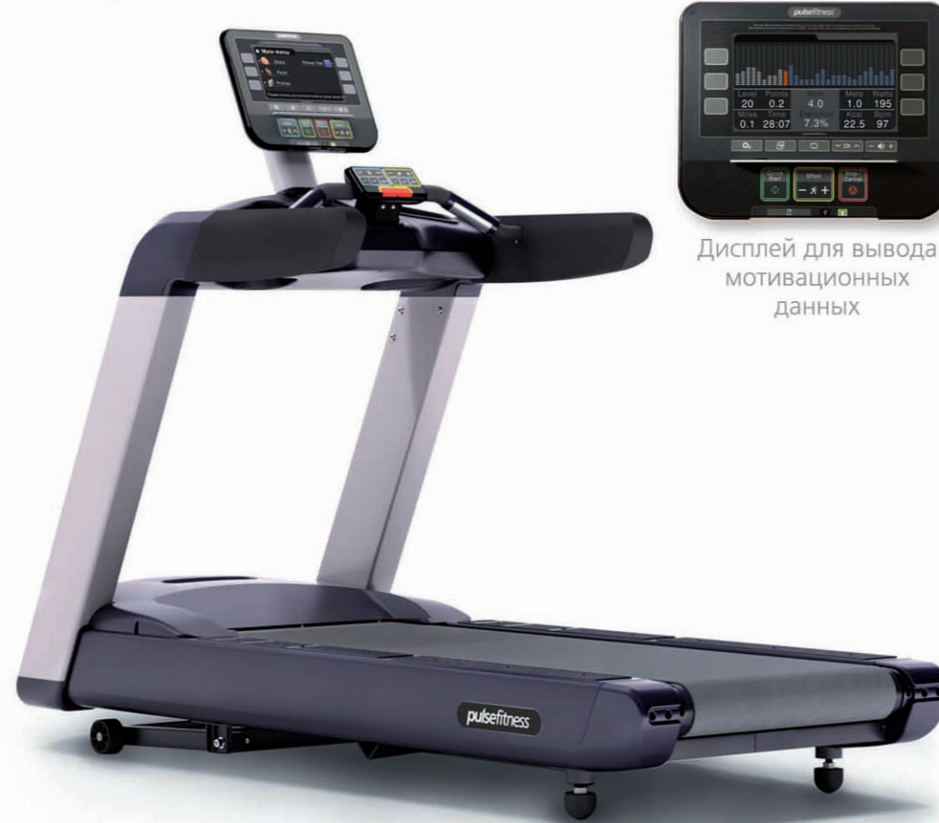
Дисплей для вывода мотивационных данных

Пользовательские функции усилены технологией развлечений Fusion и «зоной быстрого контроля», позволяющей осуществлять регулировку скорости и угла наклона, не прерывая тренировку. Для дополнительной безопасности применен страховочный шнур на магните и многочисленные элементы повышенной надежности, такие как прорезиненная двусторонняя дека с низким воздействием на суставы и самосмазывающееся беговое полотно. Таким образом, обеспечивается безопасное в использовании и экономное в обслуживании решение.