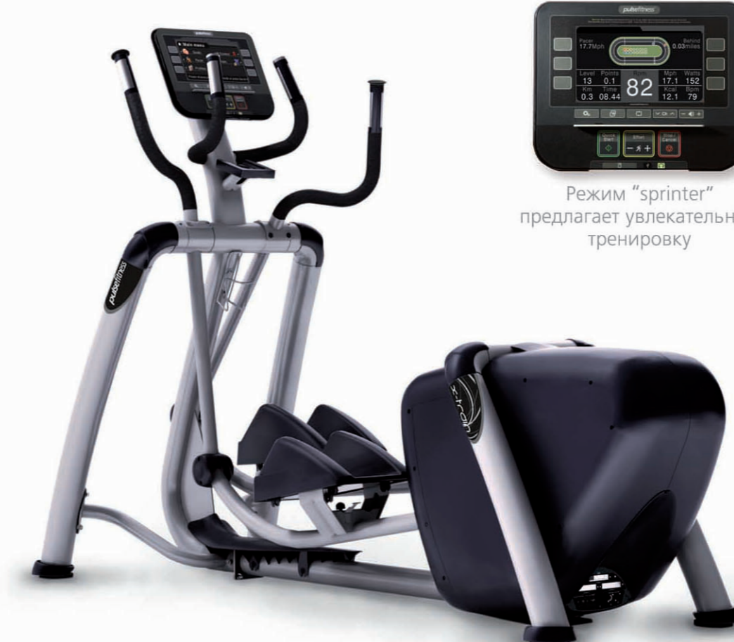
Режим "sprinter" предлагает увлекательную тренировку

Усовершенствованная модель популярного орбитрека Pulse Extreme включает в себя все преимущества технологии развлечений Fusion. Этот привлекательный, разносторонний и практичный тренажер осуществляет тренировку для всего тела, которая подойдет даже новичкам. Спроектированный для полной интеграции со всеми моделями из линии Fusion, он воодушевляет своей современностью и эффективностью.